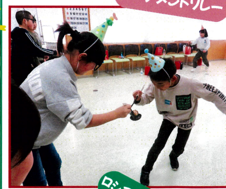
ロシアンシュークリーム