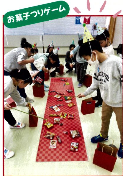
お菓子つりゲーム