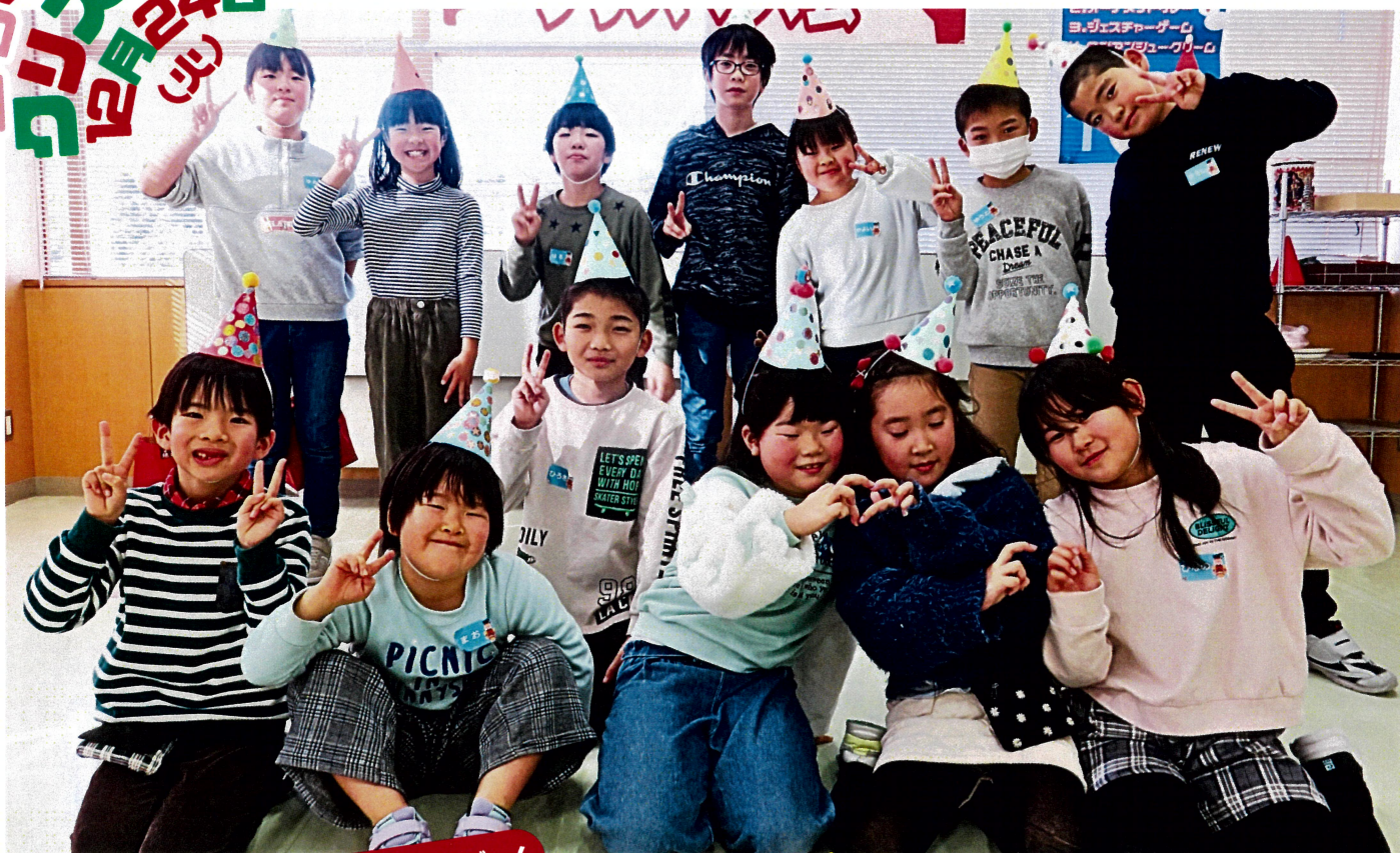
ジェスチャーゲーム